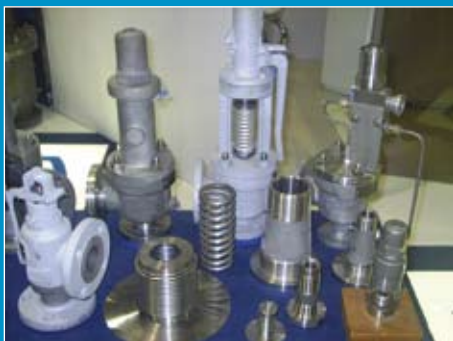
Válvulas de segurança e alívio

Você sabia que uma Plataforma de Petróleo que produz 180 mil barris possui em média 13.000 válvulas?