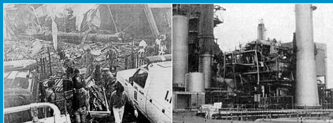
Válvulas são a diferença entre o equipamento submetido à pressão controlada e a explosão, por vezes catastrófica.

Você sabia que uma Plataforma de Petróleo que produz 180 mil barris possui em média 13.000 válvulas?