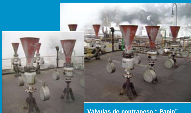
Válvulas de contrapeso " Papin "

São dispositivos de proteção para equipamentos e tubulações contra pressões excessivas, devendo abrir com absoluta segurança quando a pressão atingir um valor pré-determinado e permitir uma vazão impedindo que a pressão ultrapasse o limite.